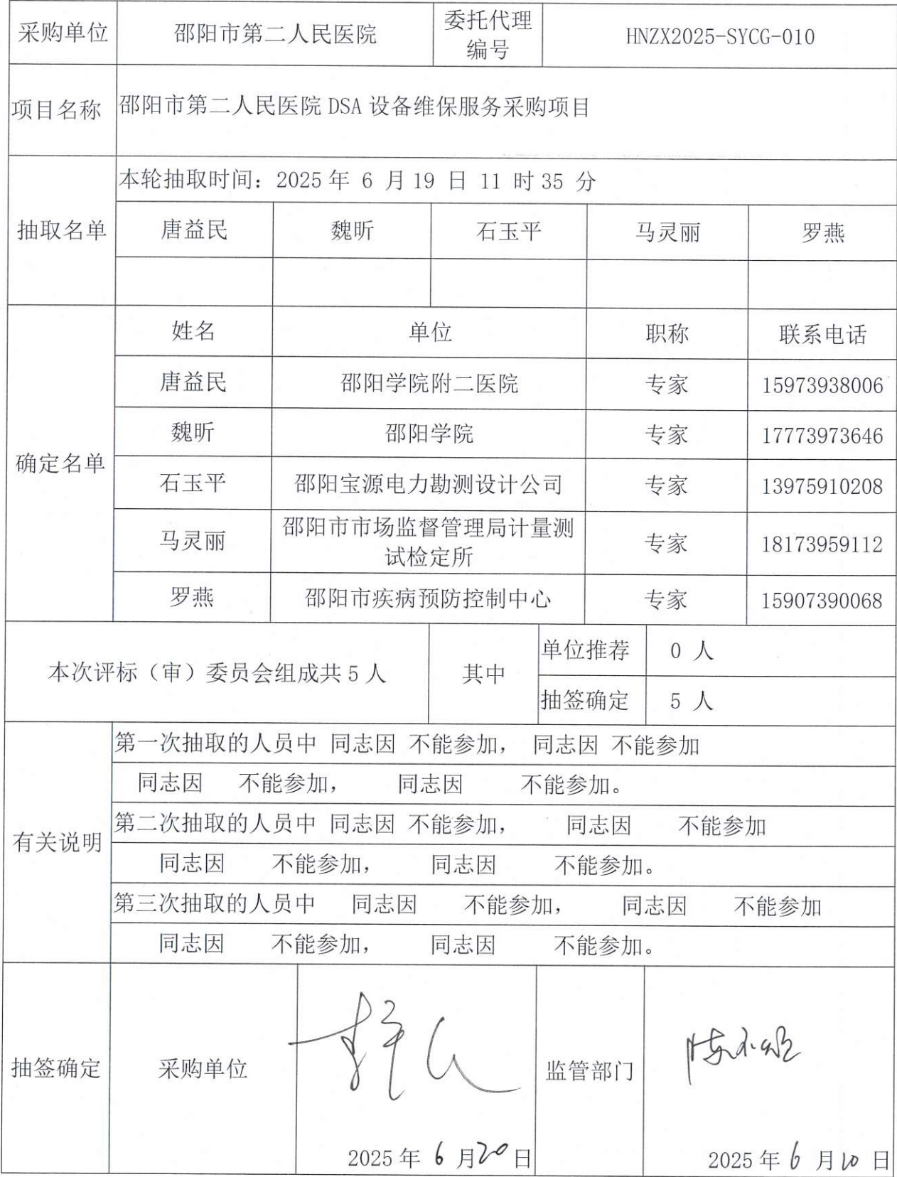
政府采购评审专家抽取与确定记录表